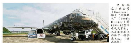
巴西航空工业公司(Embraer)型号“利润猎人”(Profit Hunter)的E190-E2型号喷气式客机，也是航空展上的其中一种参展飞机。

迅速反弹，商务航班就是其中之一。” 他说，根据私人飞机购买融资机构的报告，今年1月至7月间，全球商务航班已恢复到2019年疫情前的水平。雪州也希望能成为这个快速增长市场中的一份子。