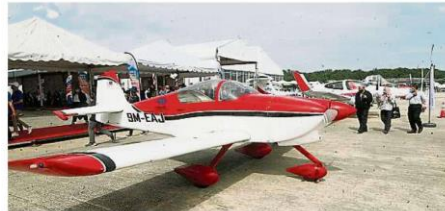
航空业和相关领域的学生除了可以透过雪州航空展进行商务与技术等方面的交流，还能近距离参观展出的各类型飞机。