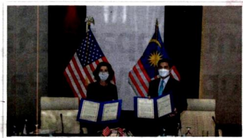
Lawatan Setiausaha Perdagangan AS, Gina M. Raimondo ke Malaysia.

Pada 24 November 2021 Turkish Aerospace membuka pejabat baharunya di kampus Cyberview Futurise di Selangor iaitu pejabat kejuruteraan dan reka bentuk pertama syarikat tersebut di Asia Tenggara.