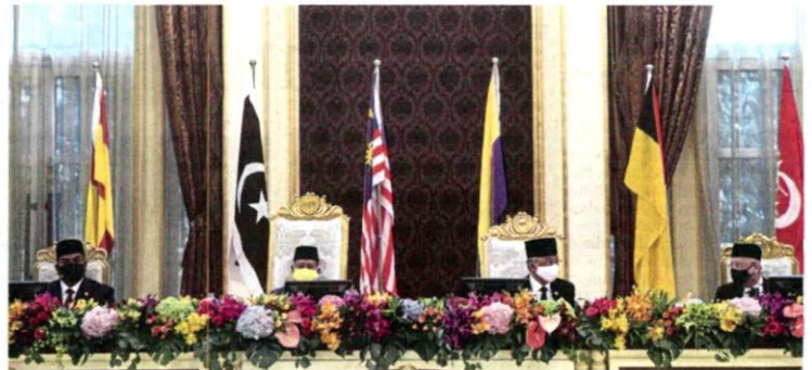
Al-Sultan Abdullah berkenan hadir ke Mesyuarat Majlis Raja-Raja Ke-257 yang dipengerusikan Sultan Sallehuddin di Istana Negara, semalam. Turut hadir, Ismail Sabri dan Menteri Besar Kedah, Datuk Seri Muhammad Sanusi Md Nor (kiri).