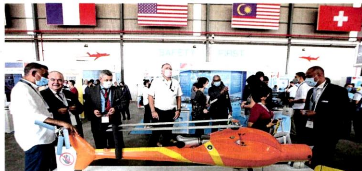
Orang ramai melihat Pameran Penerbangan Selangor 2021 (SAS2021) di Shah Alam, semalam.

"Mereka sentiasa berhubung rapat dengan kami menerusi Peja-