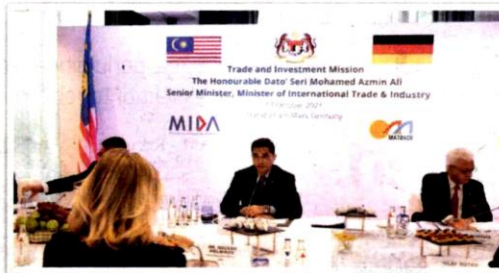
Menteri MITI, Datuk Seri Mohamed Azmin Ali ketika menyertai mesyuarat berkaitan misi perdagangan dan pelaburan di Frankfurt, Jerman.